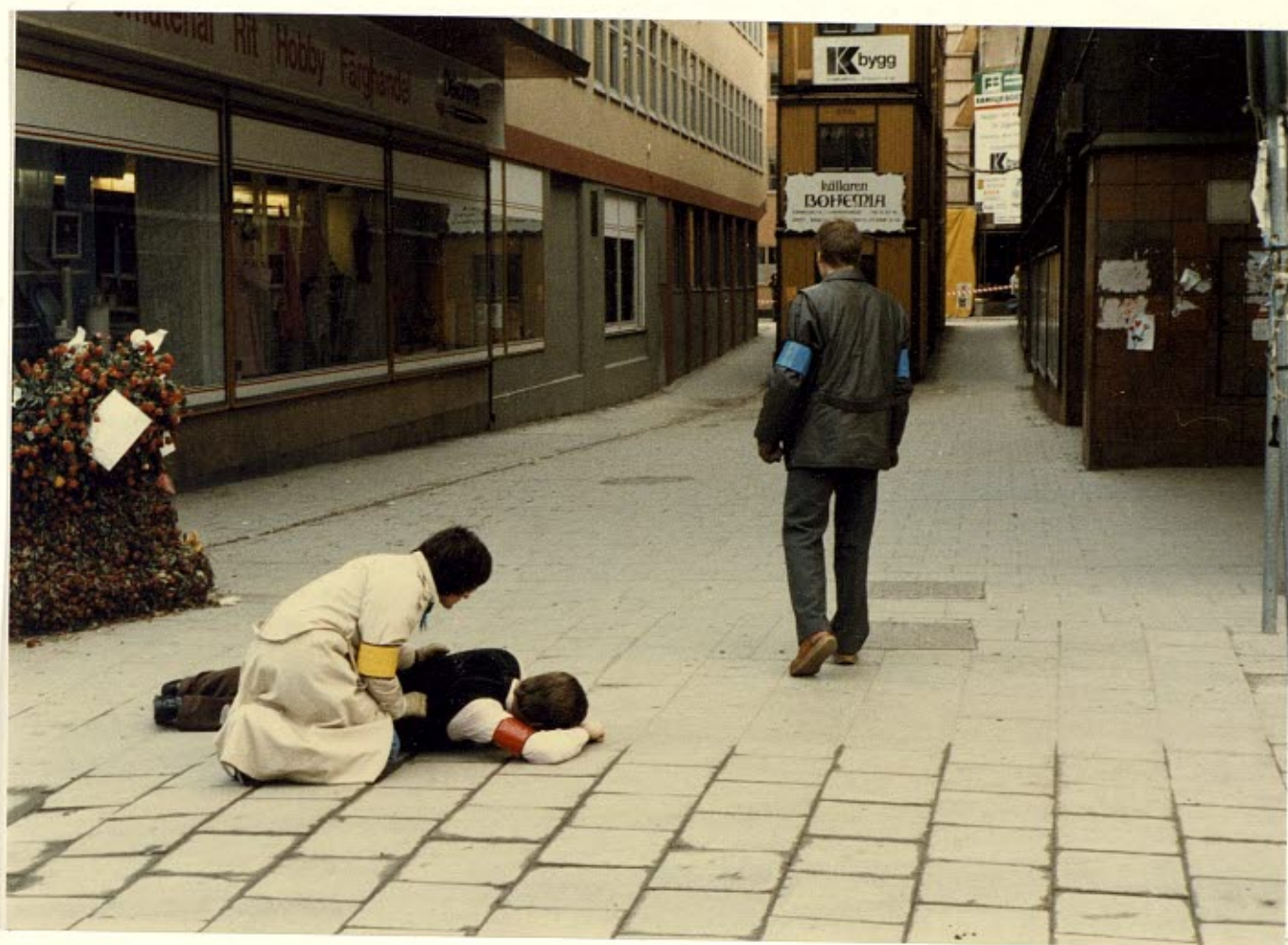
Gärningsmannen försvann springande in i gränden Tunnelgatan österut.