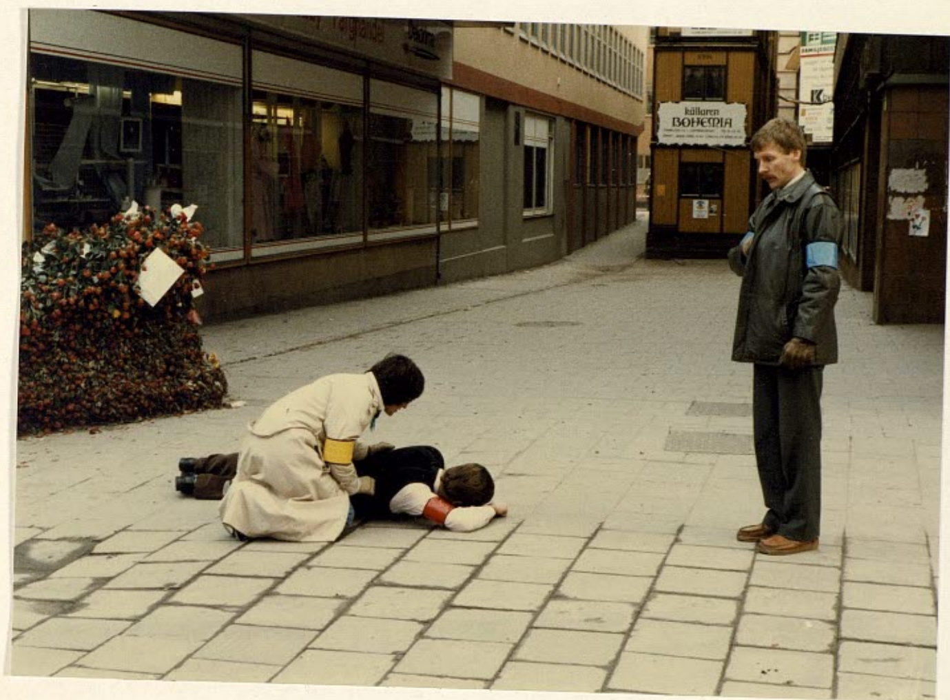
Gärningsmannen stoppade in vapnet innanför rocken.