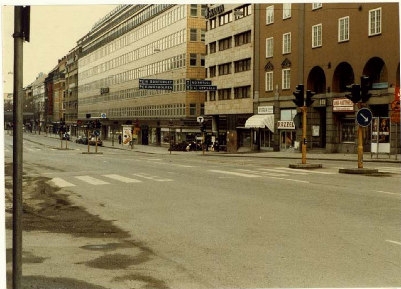
Händelseförloppet fotograferat från Egon Enokssons position.