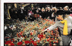
Sörjande vid platsen för mordet på statsminister Olof Palme på Sveavägen i Stockholm 1986.