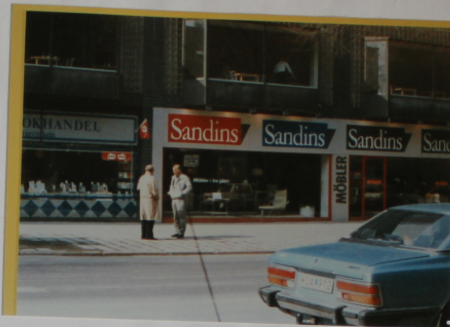
Den position utanför bokhandeln som paret Palme, sonen Mårten och dennes fästmö hade under samtalet efter biobesöket.