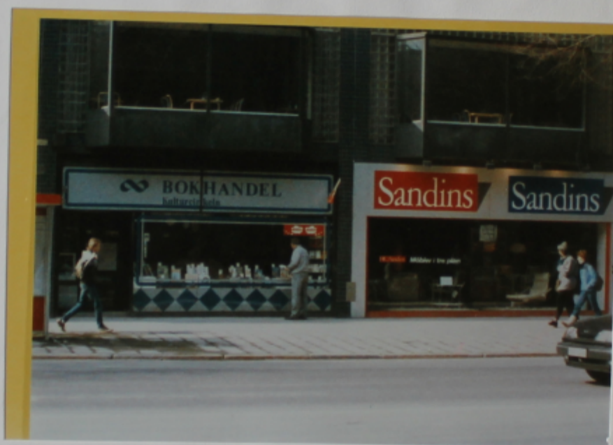
Bilden visar den position Mårten Palme hade då han går fram till bokhandelsfönstret och upptäcker en okänd man som står och tittar in i Sandins möbelaffär ca 15 meter till höger om Mårten.