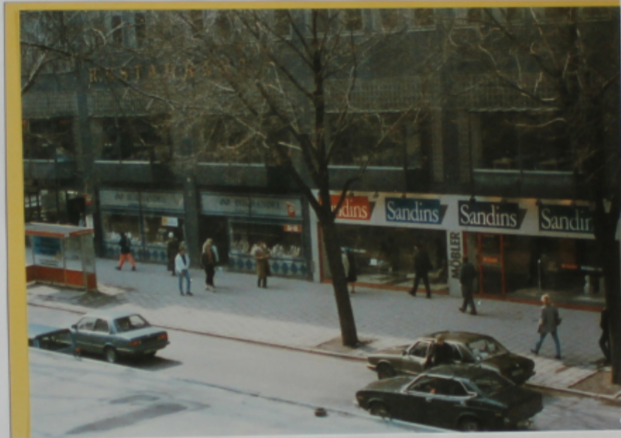
Översiktsbilder över Sveavägen med Grandbiografen och trottoaren söderut mot Kammakargatan.