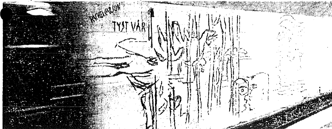
Siri Derkerts beställningsverk för tunnelbanan — här T-banestationen vid Östermalm — utgör ett exempel på hur viss del av produktionskostnaderna avsätts till konst.