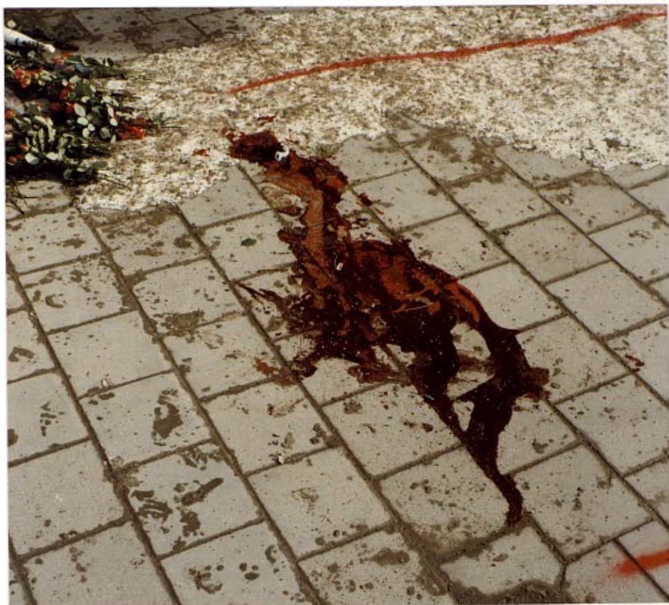
Foto 12. Mordplatsen.