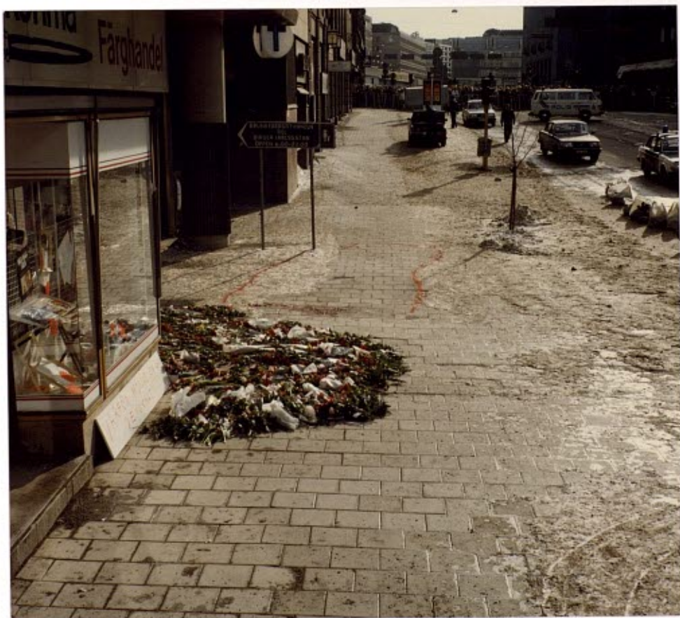
Foto 13. Sveavägens östra trottoar fotograferad mot Appelbergsgatan -dit avspärningarna flyttades- och Kungsgatan. Innanför det rödmarkerade området finns ett femtiotal blodstänk, de flesta med stänkriktning som skissen visar. I bildens högerkant ses säckar med inopsopad lös sandblandad snö.