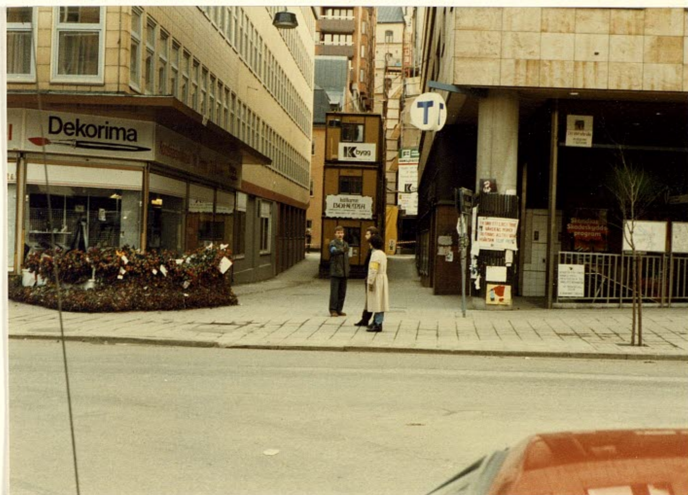
Händelseförloppet fotograferat invid Charlotte Liljedahls position.