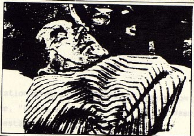
Den 19 maj 1972 exploderade två terroristbomber i Springers tidningshus i Hamburg. 17 skadades.