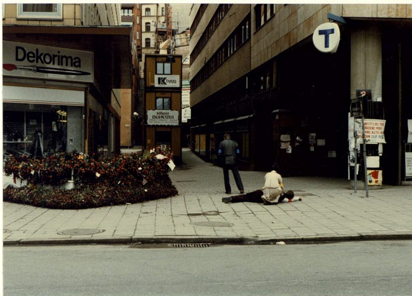
Händelseförloppet fotograferat från Leif Ljungqvists position.