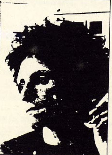
... i Baader-Meinhof-ligan: Ulrike Meinhof, Andreas Baader, Jan-Carl Raspe ... Gudrun Ensslin.

bil stoppas av polisen och de försöker skjuta sig fria.