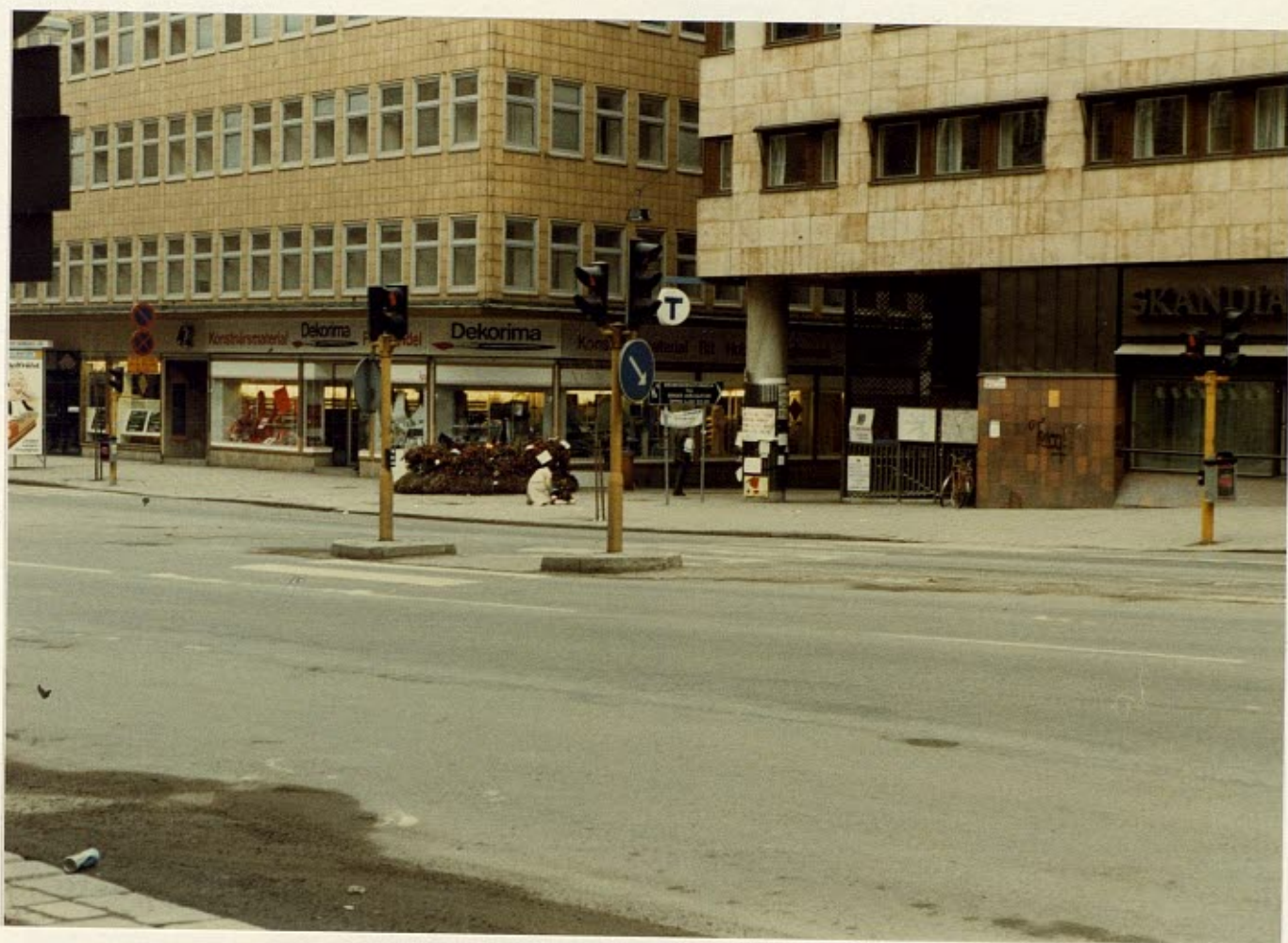
Händelseförloppet fotograferat från Ulrika Rytteståls position.