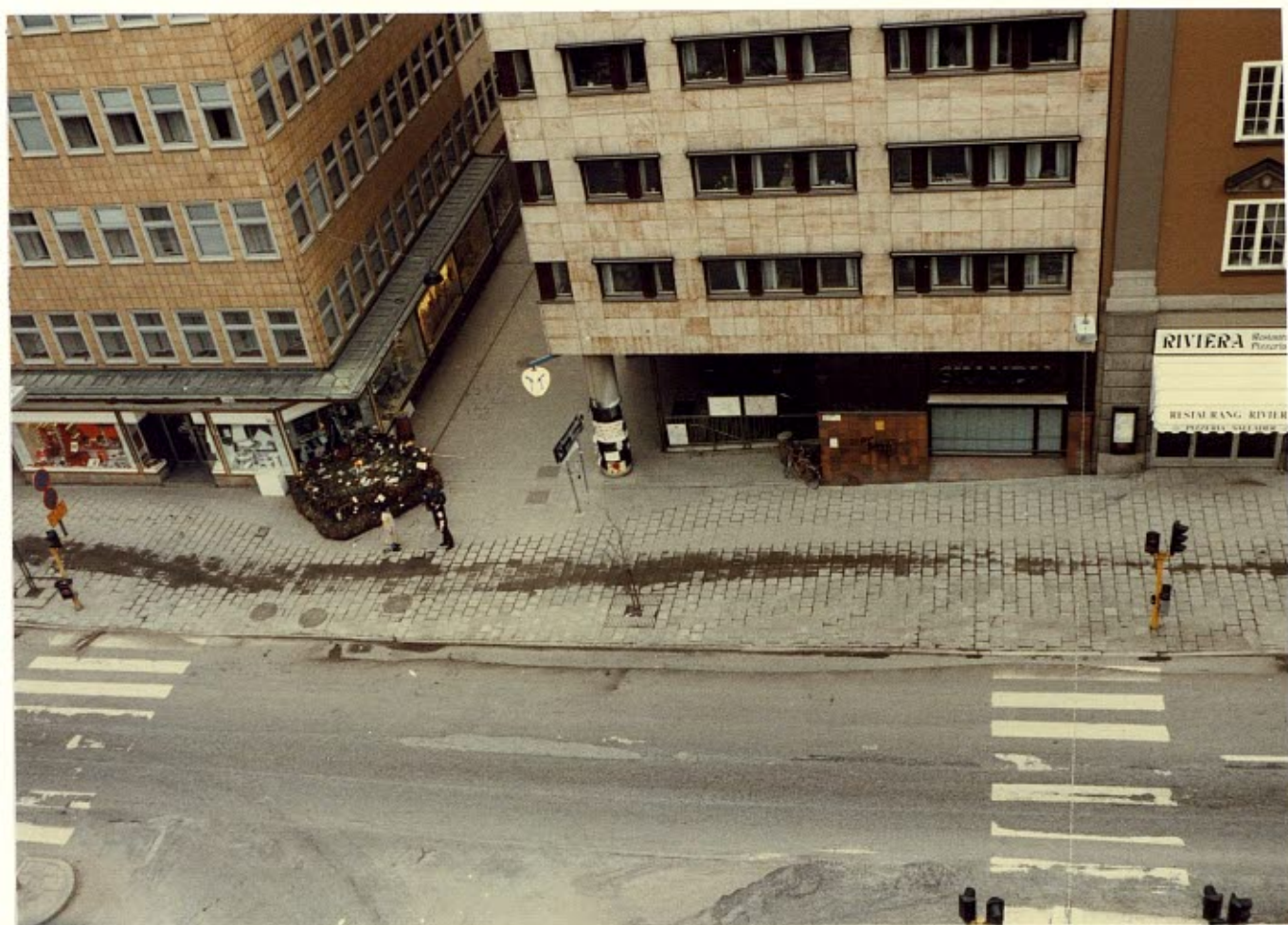
De tre personernas inbördes positioner fotograferat ovanifrån och ur annan vinkel.