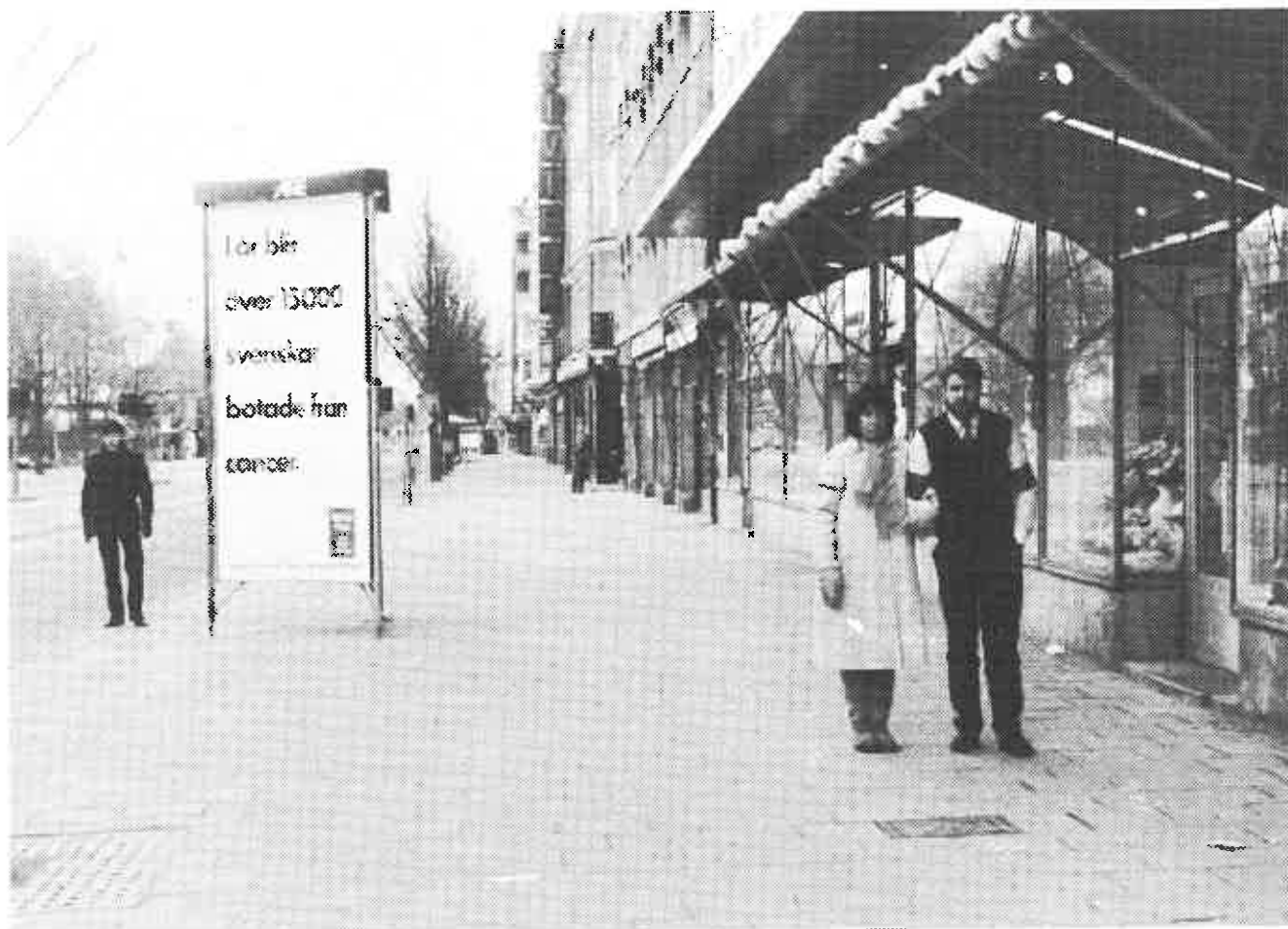
Nicola Fauzzi såg en man, som kom gående ca 10 meter efter makarna Palme.