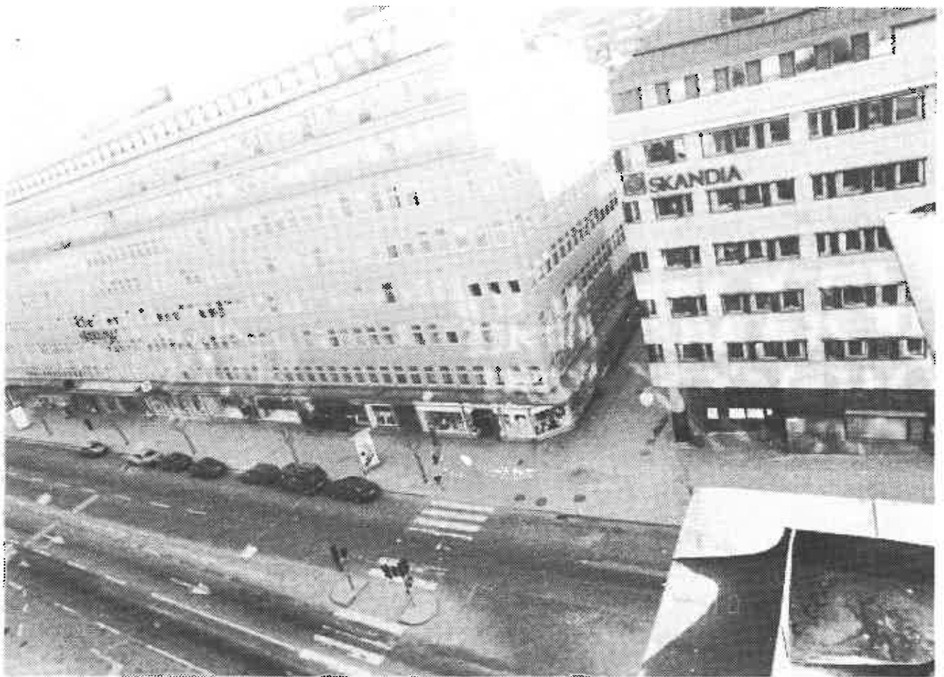
Nicola Fauzzi promenerade Sveavägen norrut på den östra trottoaren.