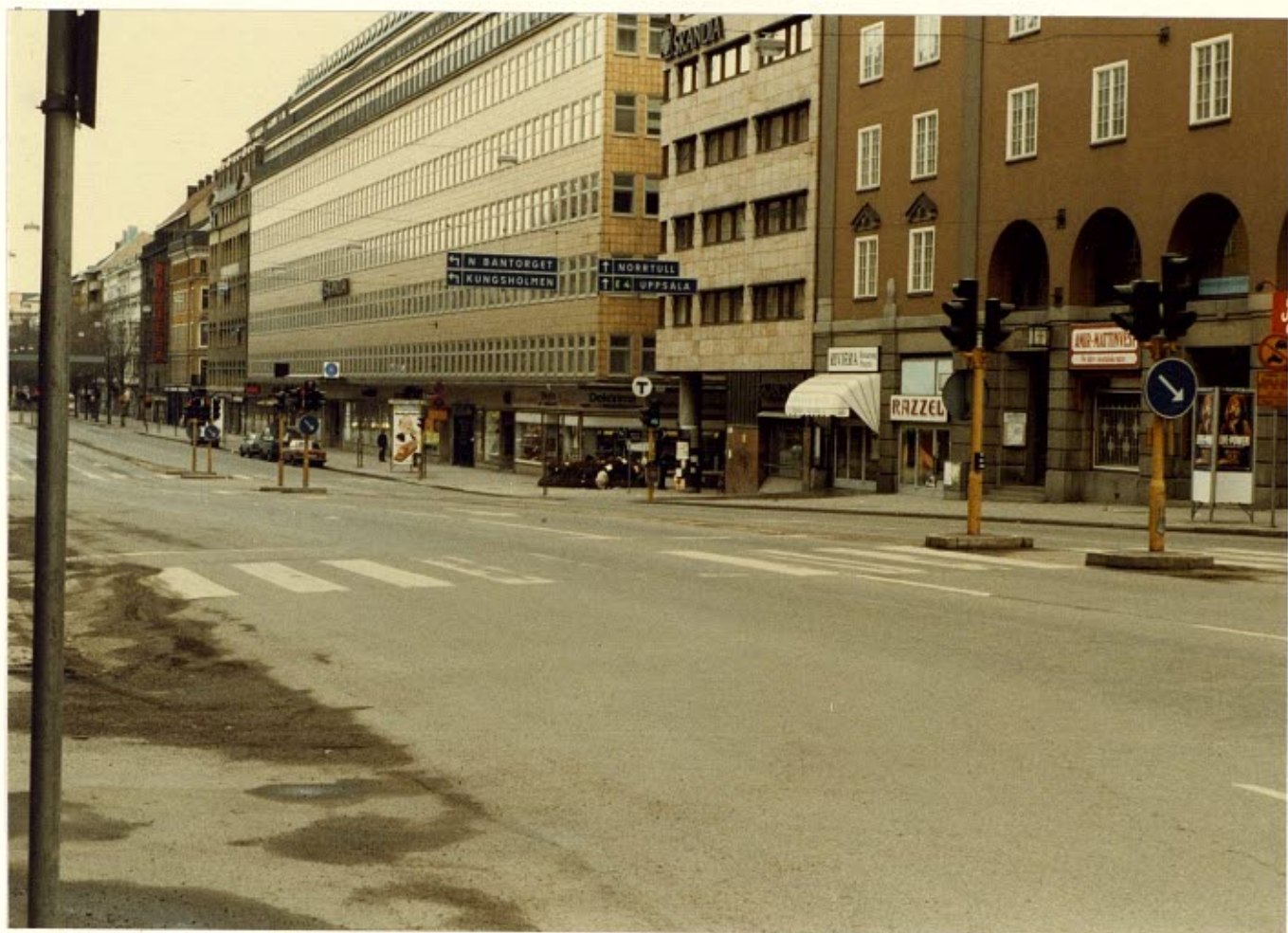
Händelseförloppet fotograferat från Egon Enokssons position.