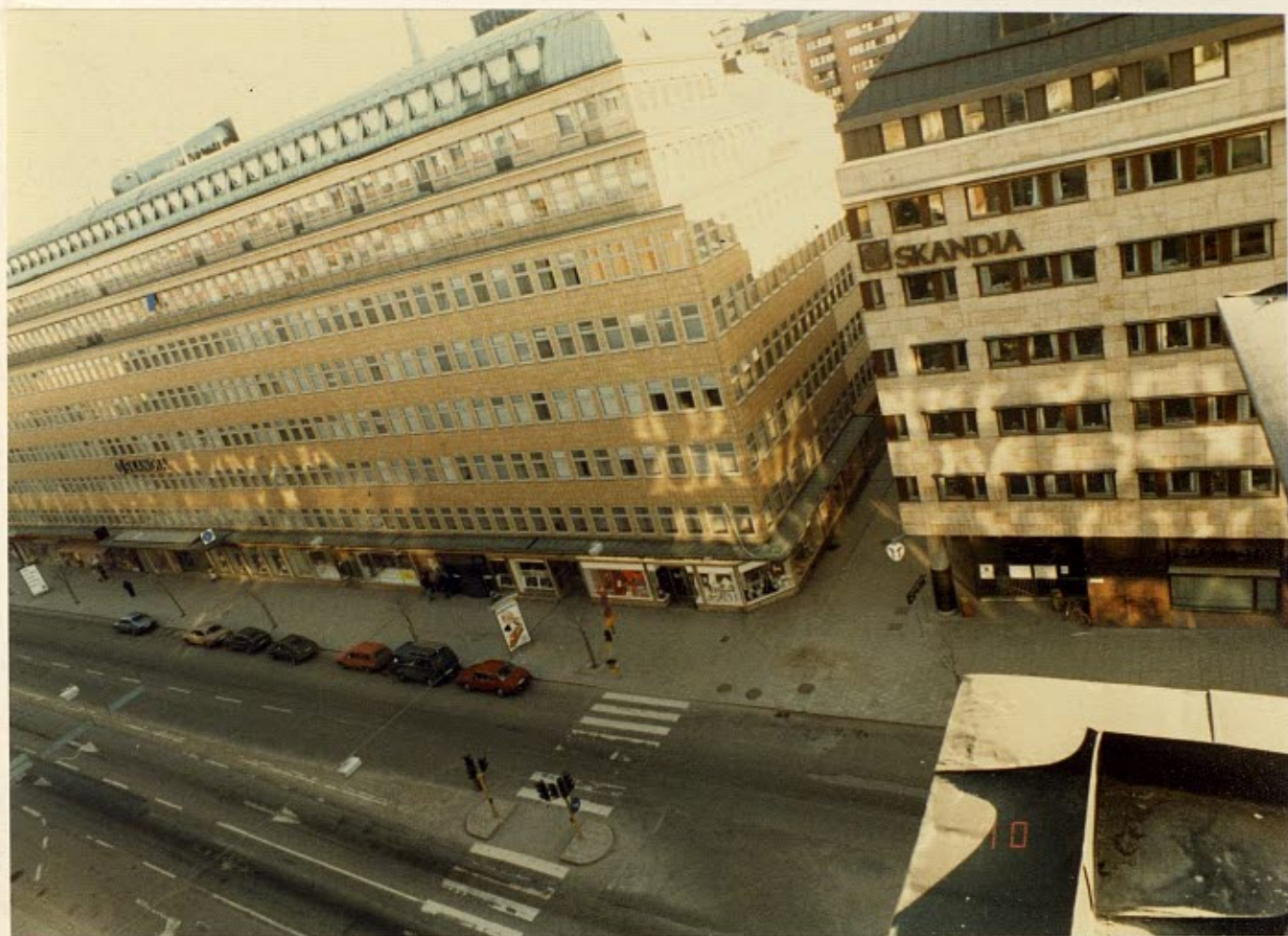
Nicola Fauzzi promenerade Sveavägen norrut på den östra trottoaren.