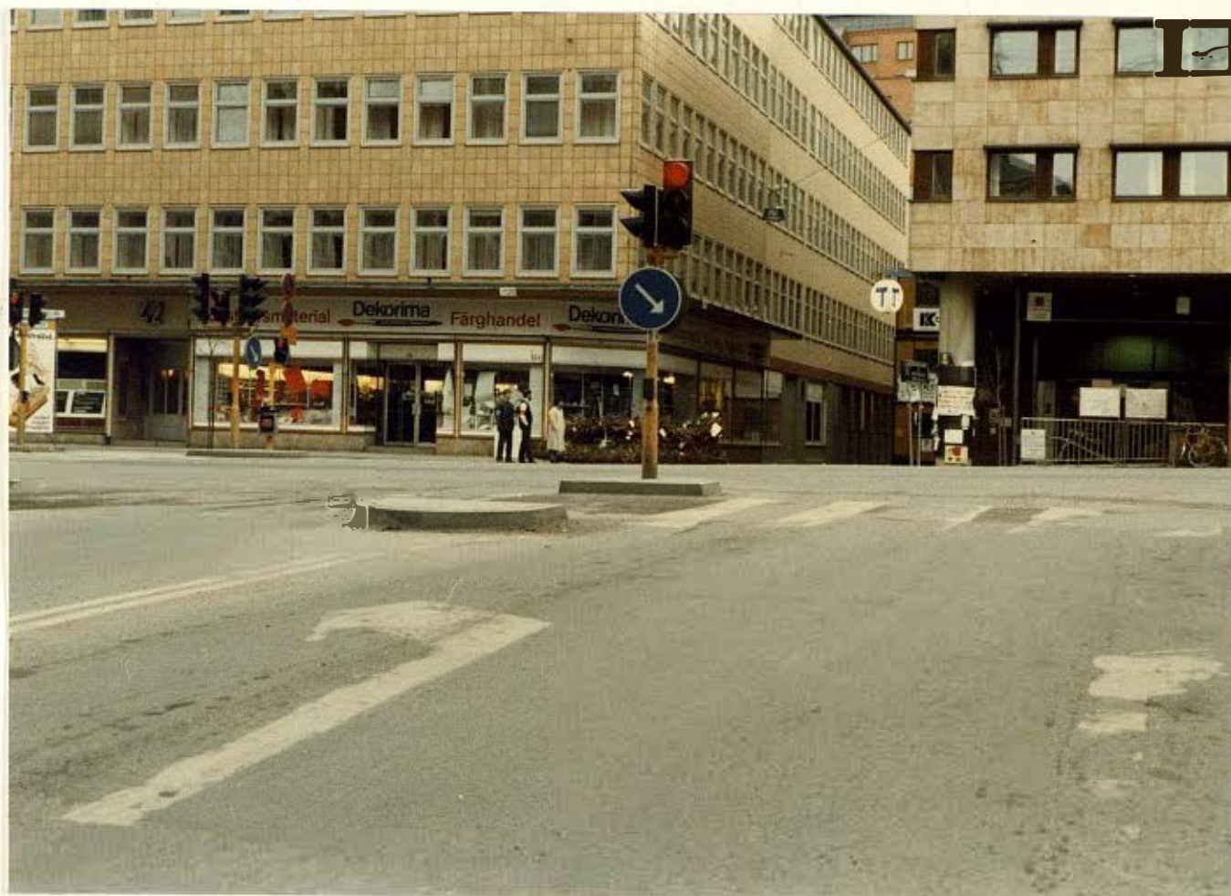
Händelseförloppet fotograferat från Inge Morelius position.