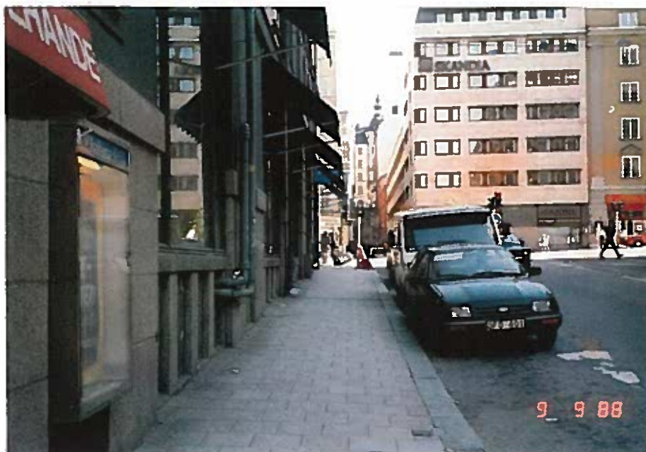
Foto taget från den position som mannen befinner sig vid. Fotot ger en bild av det synfält mannen hade då han blickade upp mot Sveavägen.