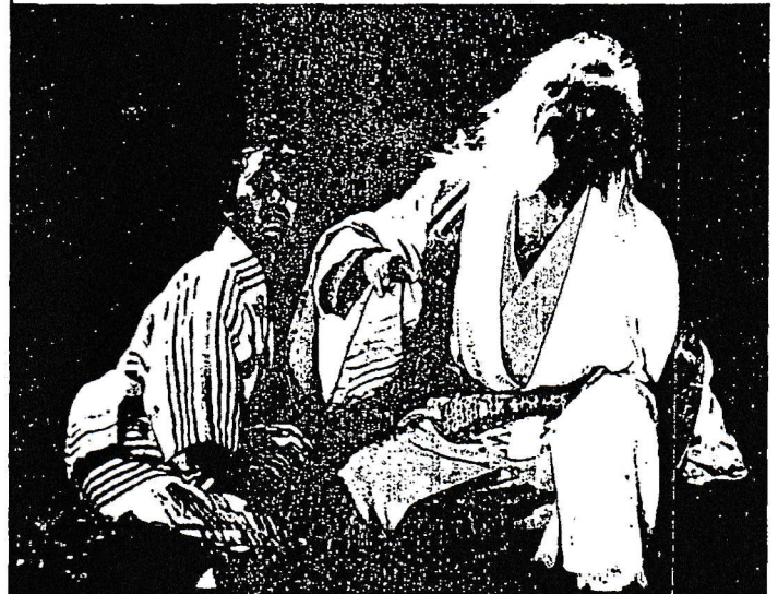
Peter, Tatsuya Nakadai

Mot slutet av Sengoku-epoken (1467-1582) var de olika klanerna i det japanska öriket inblandade i blodiga bataljer för att värna sina landområden. En mäktig härskare vid namn Hidetora Ichimonji vill på sin ålders höst dra sig tillbaka. Inför sina främsta vasaller efter en lyckad vildsvinsjakt överlåter han sina tre borgar åt sina tre söner och utser samtidigt den äldste, Taro, till klanens överhuvud. Den yngste sonen, Saburo, som omedelbart förutser stridigheter mellan de äldre bröderna Taro och Jiro, vägrar att acceptera faderns beslut. Han anklagar vidare den gamle mannen för att vara åderförkalkad. Hidetora blir rasande och förvisar Saburo från sitt rike . . . Maktlystand, hat och passioner leder till våldsamma strider och Jiro blir den ende överlevande av klanen.