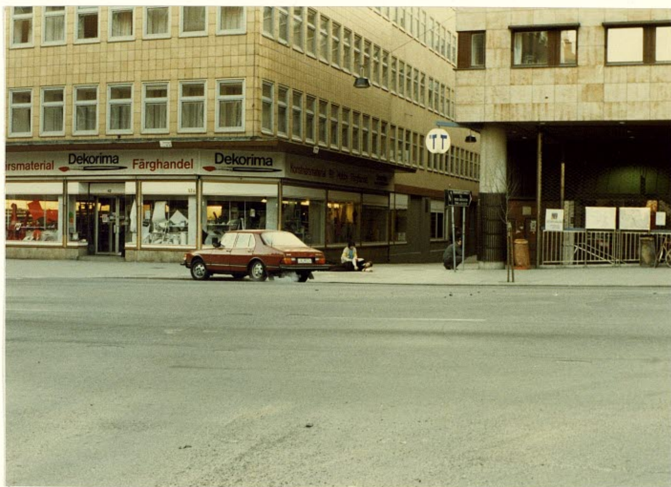
Händelseförloppet fotograferat från Jan Nilssons position.